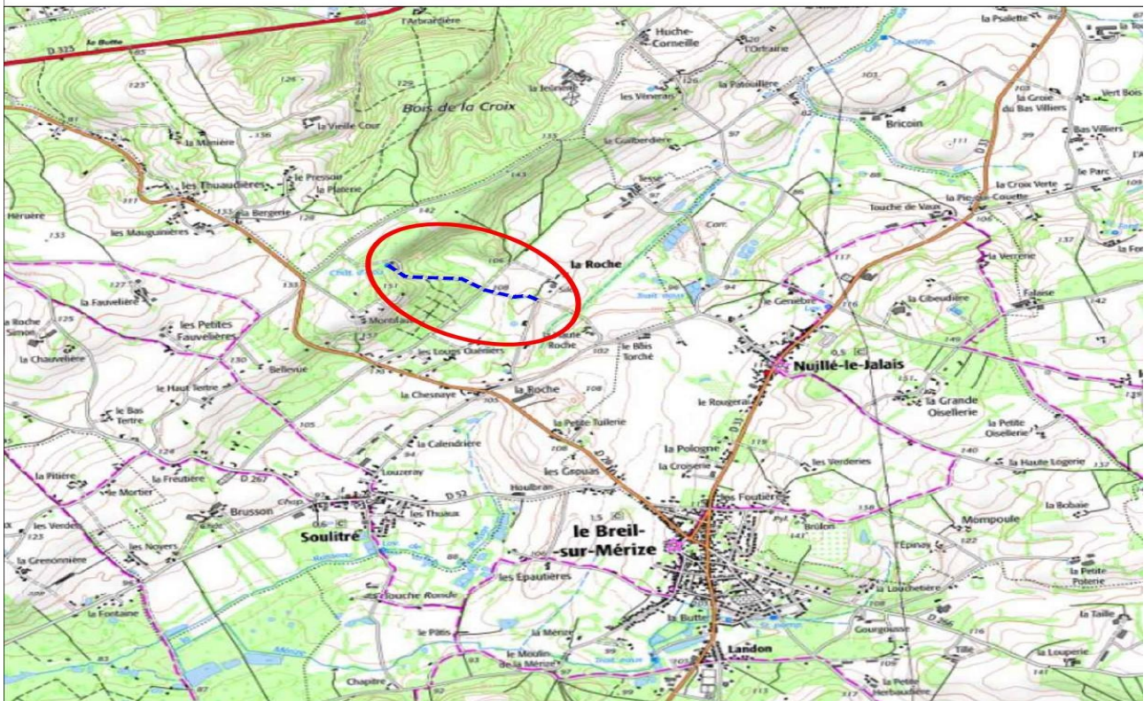
PLAN DE SITUATION Echelle : 1/25.000°

Monsieur le Président rappelle aux membres du Conseil Syndical du SIAEP du JALAIS, que nous souhaitons poursuivre les travaux d'Adduction d'Eau Potable sur 2024 et réaliser une interconnexion de SECURISATION entre la production du Juppeau (Forage de la Cibeudiaire) et le réservoir surélevé de Montifaut commune de SOULITRE.